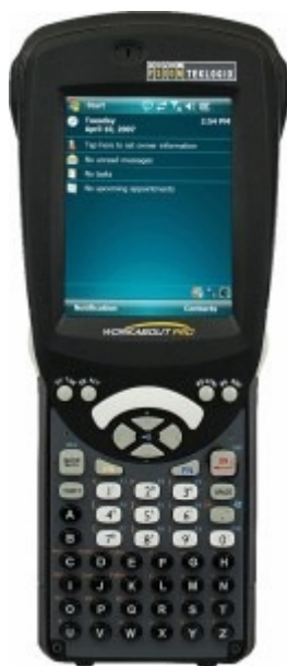
RFID четец с компютър